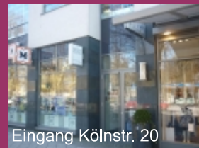
Eingang Kölnstr. 20