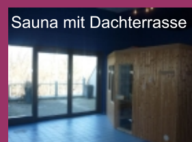
Sauna mit Dachterrasse