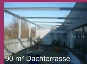
90 m² Dachterrasse